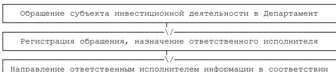
СХЕМА СОПРОВОЖДЕНИЯ НА ТЕРРИТОРИИ ОРЛОВСКОЙ ОБЛАСТИ ИНВЕСТИЦИОННЫХ ПРОЕКТОВ ПО ПРИНЦИПУ "ОДНОГО ОКНА"

Приложение 1 к Регламенту сопровождения на территории Орловской области инвестиционных проектов по принципу "одного окна"